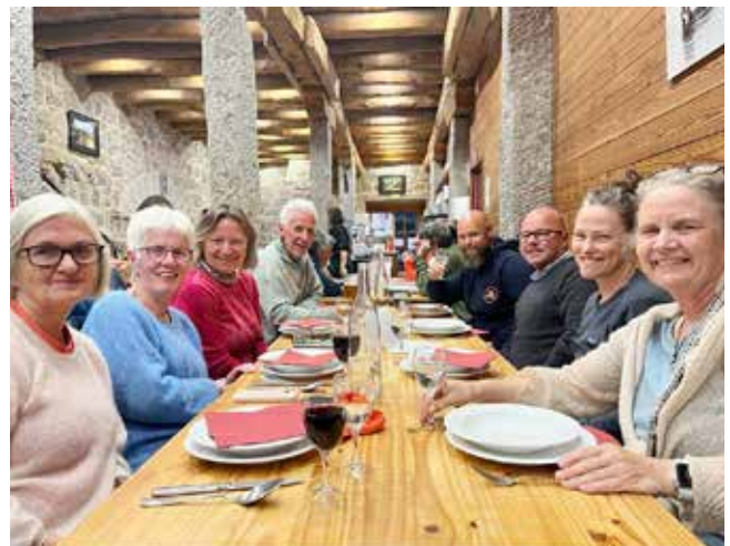
Her overnatter vi på et tidligere hospital - nå herberge. Langbord er inkludert!

Vi går mellom 20 og 30 kilometer hver dag og passerer steder som Le Puy, Saugues, Nasbinals, Estaing – før vi ender i Conques. En reise i landskap, historie og vennskap. Vi går videre året etter, takknemlige for å få oppleve verden – og hverandre – på denne måten.