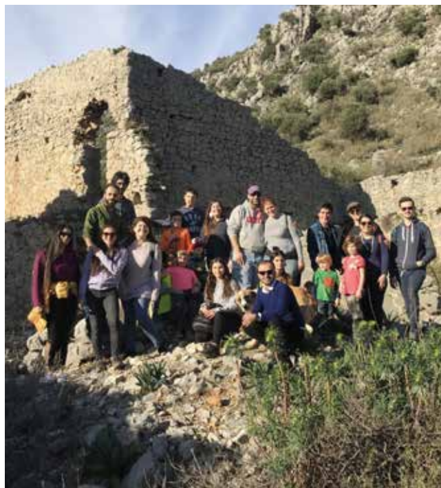
Menigheten i Antalya på tur.

Menighetens visjon er å nå ut til de stedene hvor det ikke er noen kirker eller kristne og å dele evangeliet