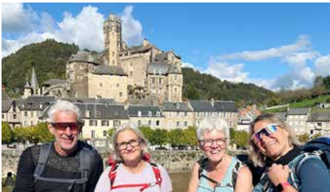
Estaing – eventyrlig, ekte og vakker

Sakte spenning: Hva skjuler seg bak neste sving? Hvilken landsby møter oss i ettermiddag? Hvor og hos hvem skal vi sove i natt? Mange landsbyer føles det som om tiden har stått stille, nesten som en tidsmaskin har tatt oss tilbake i tid. I mange andsbyer, maten, menneskene – alt bærer preg av stolthet, tradisjon og nærhet til jorden.