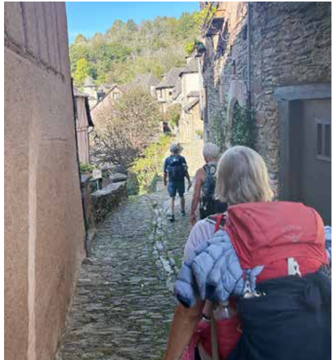
Spennende å vandre mellom disse uberørte gamle landsbyene i Frankrike.

Å bo privat gjør reisen enda rikere. Vi møtes av åpne dører, lange middagsbord og samtaler på tvers av språk og livshistorier. Enten man går alene eller sammen, blir man en del av et fellesskap.